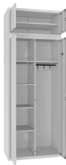
Szafa MSU 61 z nadstawką MSU 66